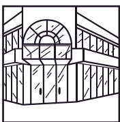
▪ Estruturas de vidro exterior