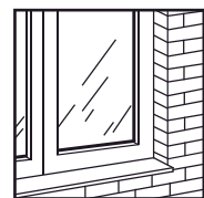
▪ Carpintaria alumínio-vidro