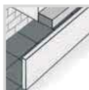
■ Pilares, estátuas e monumentos