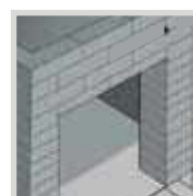
■ Interiores húmidos, sótãos, adegas e balneários