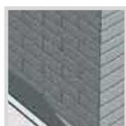
■ Muros e fachadas