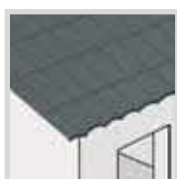
■ Telhas, cobertas e telhados